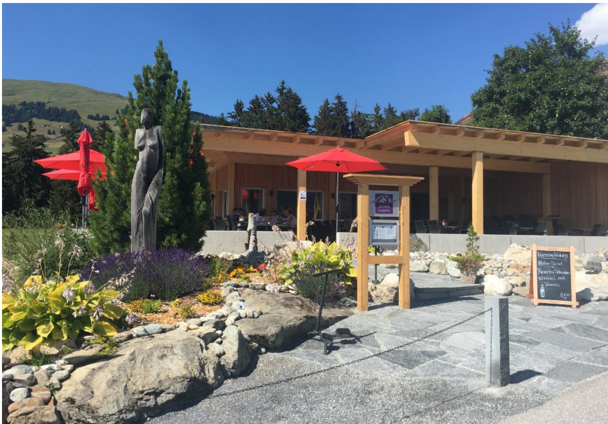
Die neue Ustria Tumpiv – ein Bijou!