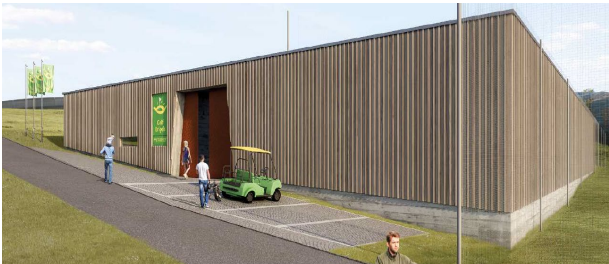
Der geplante Werkhof – eine Projektskizze!

Da es, wie dies ursprünglich geplant war, nicht möglich sein wird, das bestehende Werkhof-Provisorium durch eine Übernahme von dazu bestens passenden Räumlichkeiten der Armee abzulösen, steht der Neubau eines Werkhofs an. Ebenso ist die restliche Sanierung des Clubhauses notwendig. Zur Finanzierung dieser Projekte ist eine Kapitalerhöhung notwendig.